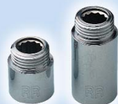
Гайка удлинительная RR 502 хром

1/2" x 10 мм В блоке, шт - 20 В упаковке, шт - 300