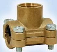
Водоотвод 4 болта латунь

1/2" x 1/2" B-227 В блоке, шт - 1 В упаковке, шт - 36