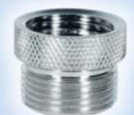
Переходник метрический никель