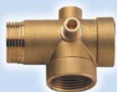
Пятерник 82 мм RR 420 латунь