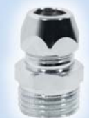
Цанга штуцер никель

1/2" x 3/8" x 10 мм Ц-1127 В блоке, шт - 10 В упаковке, шт - 400