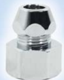
Цанга гайка никель

1/2" x 3/8" x 10 мм Ц-1127 В блоке, шт - 10 В упаковке, шт - 400